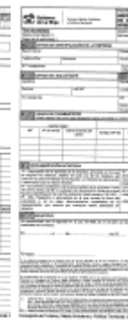
Anexo I - 11