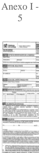
Anexo I - 5