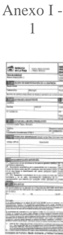
Anexo I - 1