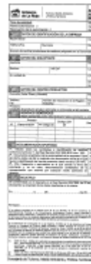
Anexo I - 2