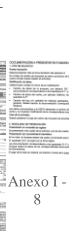
Anexo I - 8