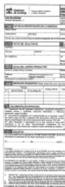
Anexo I - 10