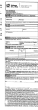
Anexo I - 3