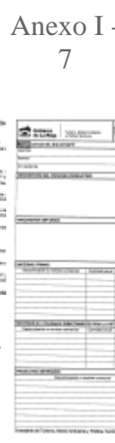
Anexo I - 7